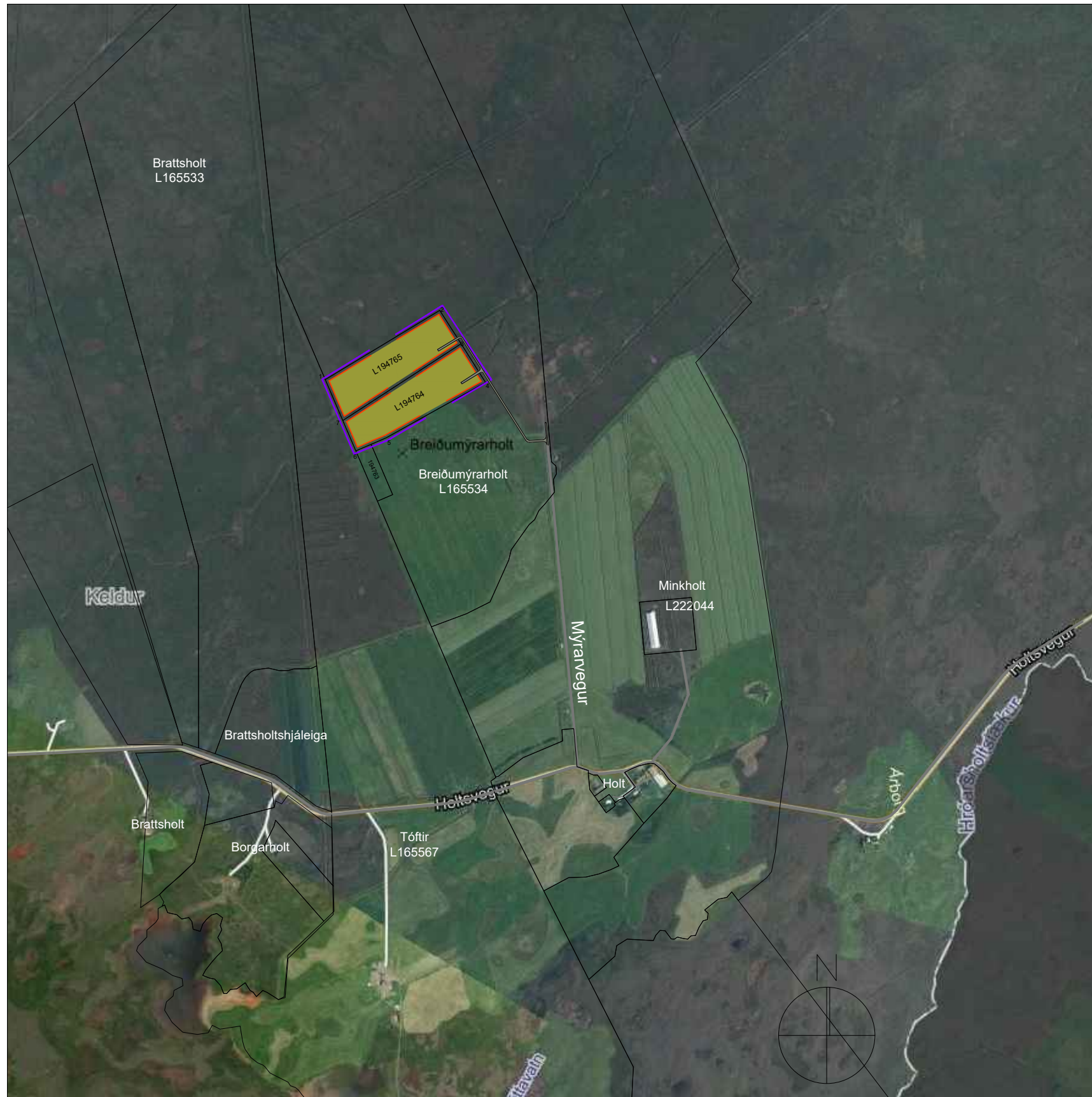
YFIRLITSMYND STAÐSETNING MKV 1:4000